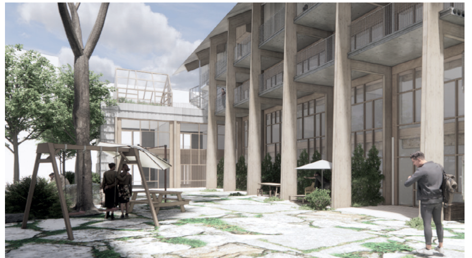
Visionsbild Kvarteret Återbruket, Lendager_Group

Framtiden Byggutveckling deltar i initiativet Handslaget, som Business Region Göteborg håller ihop. Det är en del av Göteborgs plattform för klimatneutralt byggande och syftet är bland annat att stimulera och etablera en återbruksmarknad i Göteborgsregionen.