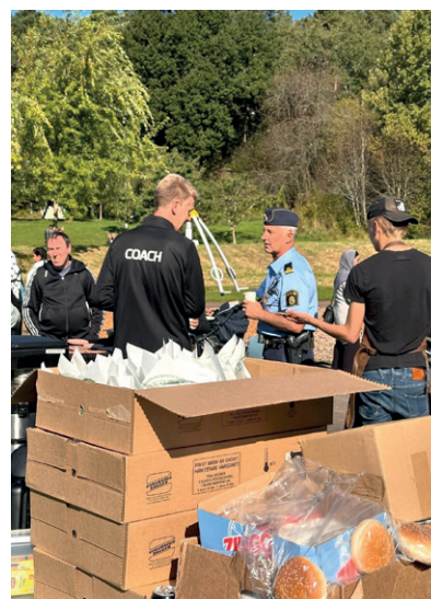
Backatorp IF var på plats.