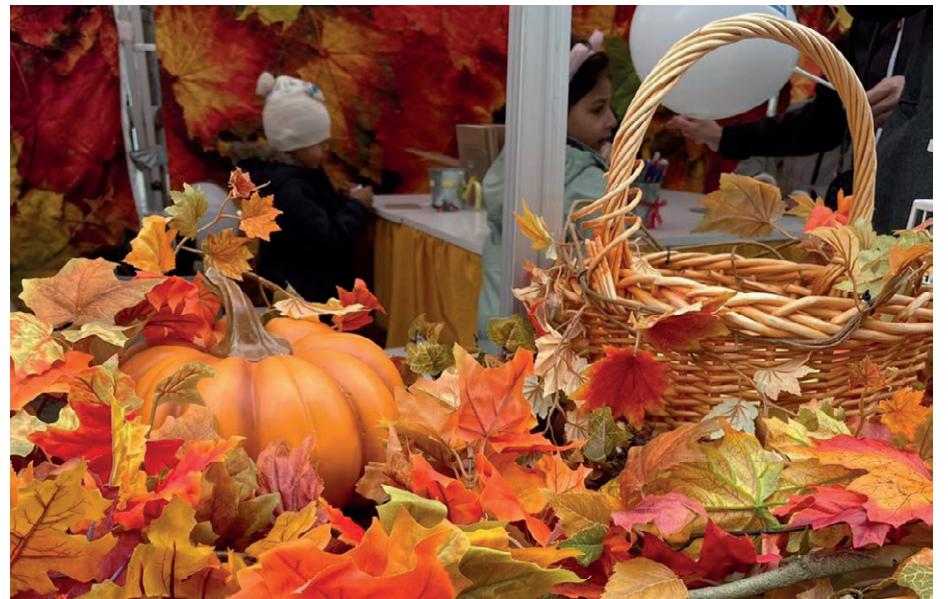
Höstkänsla blir det på Selmadagen.