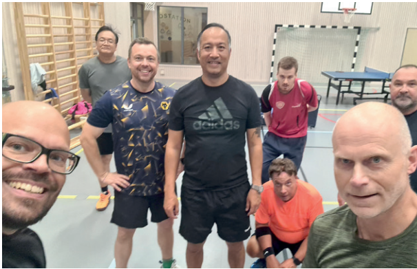
Pingsifeber i Backa BTK