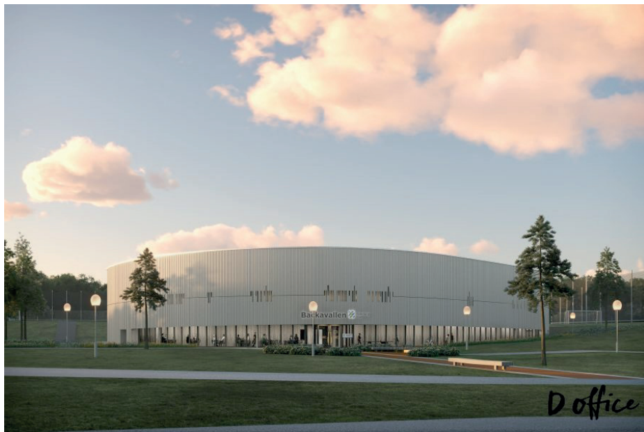
Fasaden på den nya hallen vid Backavallen. Visionsbild: D office