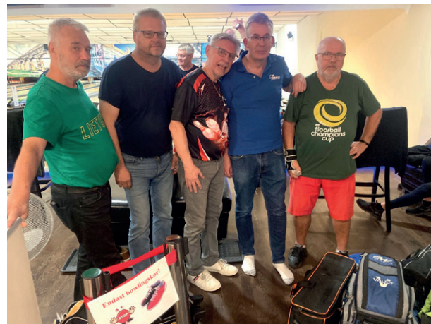
Styrelsen i The Golden Bowlers

Försäsongen är klar och nu är seriespelet igång. Förra säsongen var de nära att via kvalspel ta sig upp till division 1. Det gav