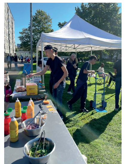
Mat gick åt i mängder under loppisen.