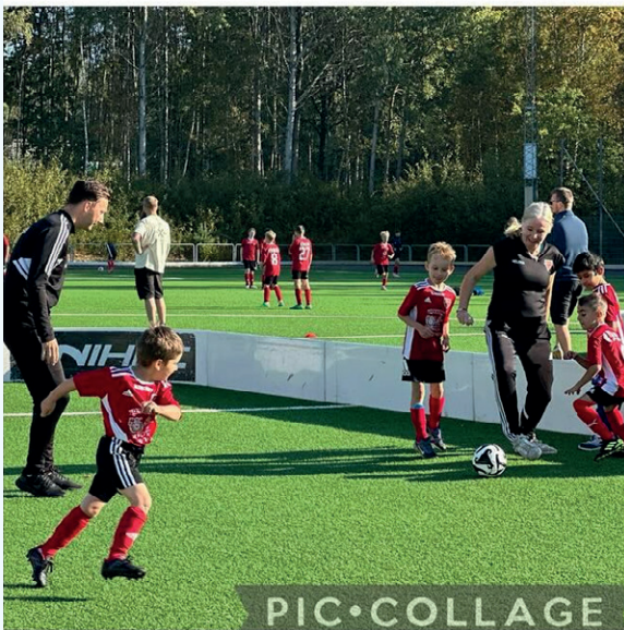
Fotboll i fokus Backatorpsdagen.