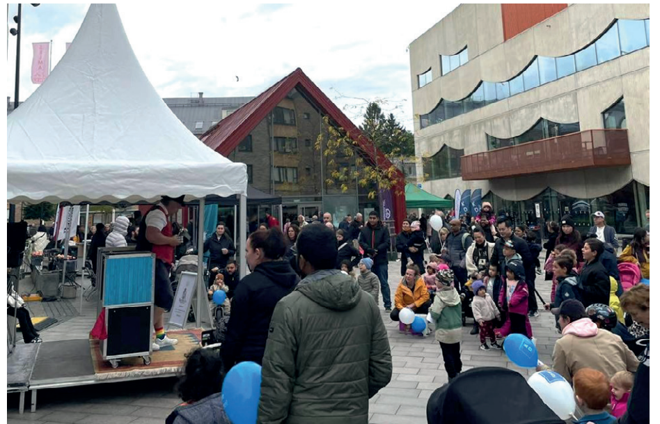
Selmadagen drar alltid mycket folk