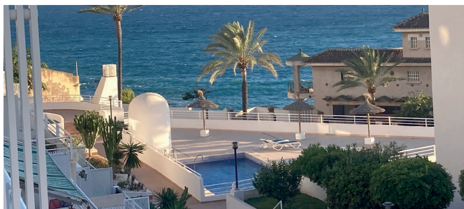
Vackraste av vyer. Att kunna titta ut över Medelhavet i slutet av oktober är själslig balsam.