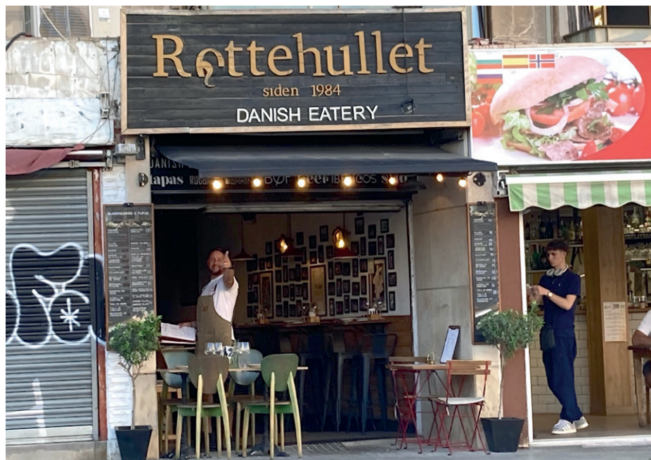
Dansk klassiker. Sedan 1984 har "Røttehålet" i Cala Mayor erbjudit smörrebröd som alternativ till Tapas.