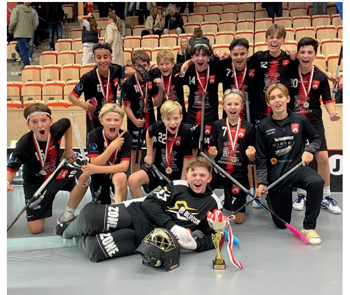
Guld i Bästcupen för Kärra IBK:s P10 i A-slutspelet.