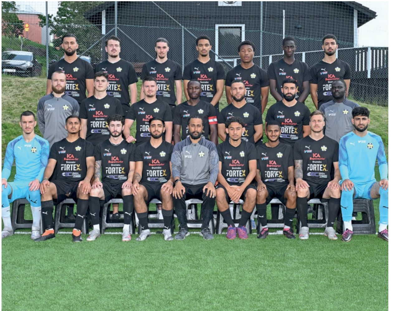
Hisingsbacka FC herrar svarade för en stark säsong.