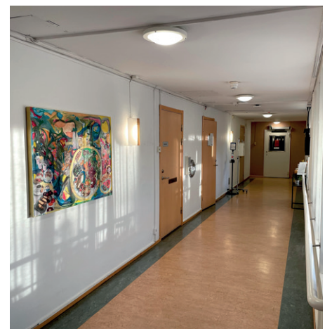
Kärarhus med vacker målning med måltidens dag.

sar att fotoutställningen kommer att vara tillgänglig under tre veckor till.