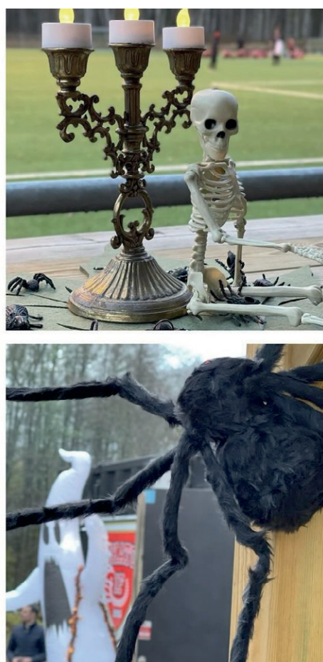
Höstlov med Halloween tema.