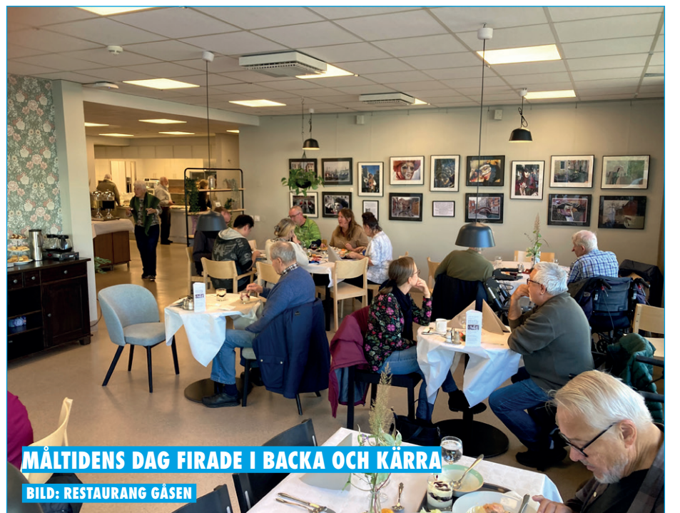
MÅLTIDENS DAG FIRADE I BACKA OCH KÄRRA