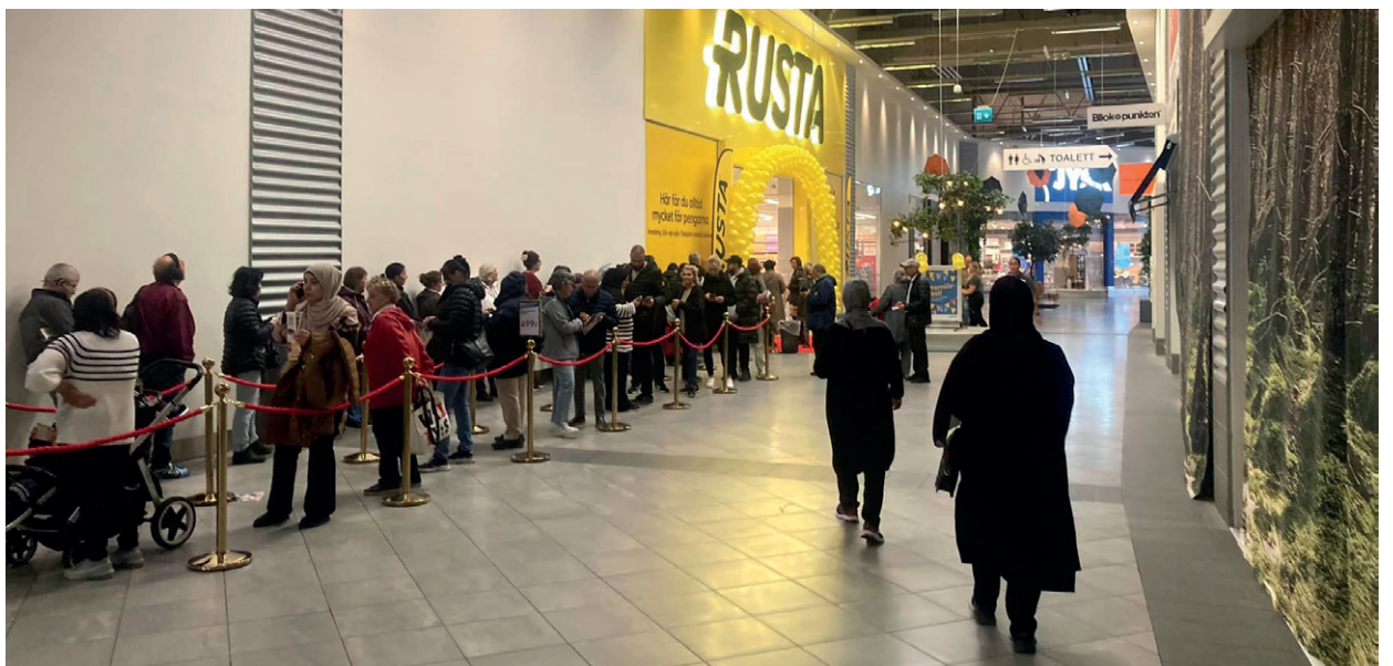
Långa köer innan öppningen av Rusta