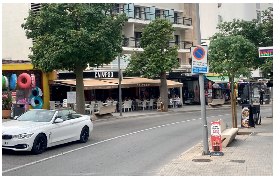
Huvudgata. Joan Miro sträcker sig från Cala Mayor hela vägen in till Palma.