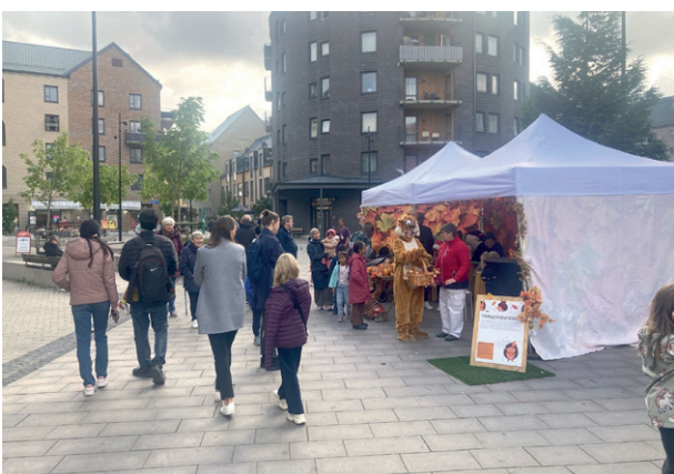
Tältet med höstmaskoten lockade många.