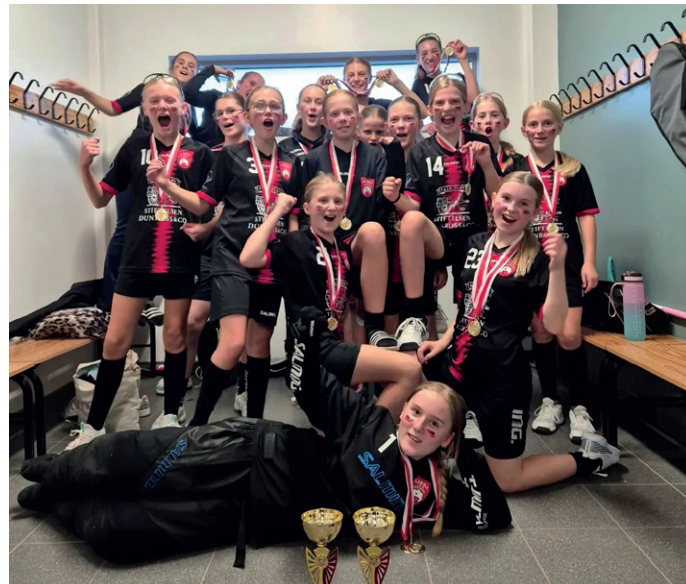
Guld och silver till Kärra IBK:s F 11 och 12 i B-slutspelet.