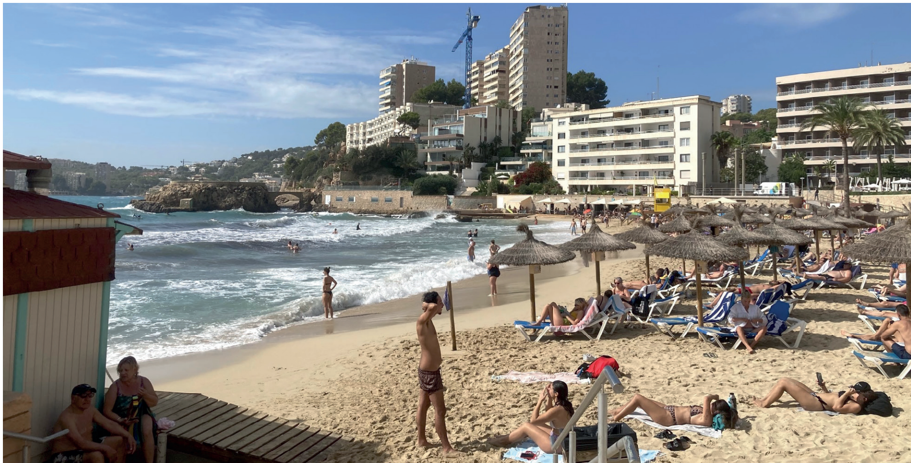
Paradis. 200 meter lång och över 80 meter bred är Cala Mayor kanske den populäraste stranden på Mallorca.