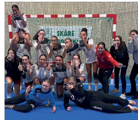
Målglada A-flickor i Backa HK.