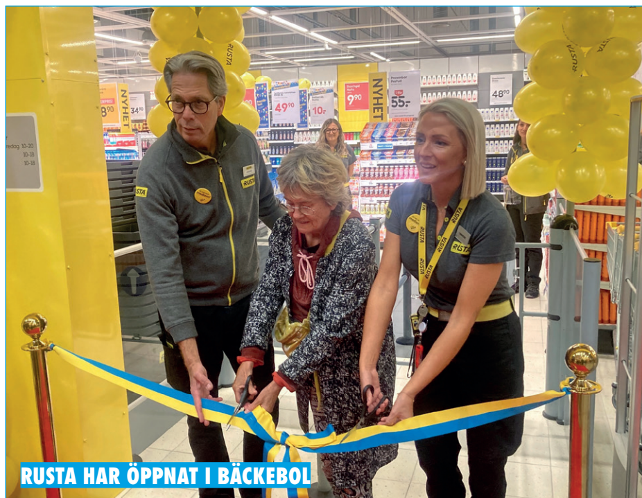
RUSTA HAR ÖPPNAT I BÄCKEBOL