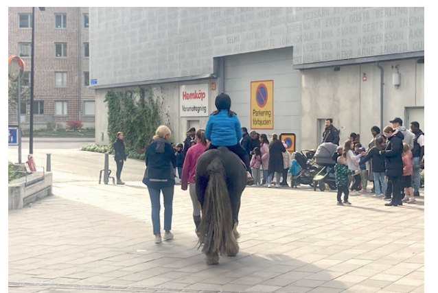
Ponnyridningen var populär.