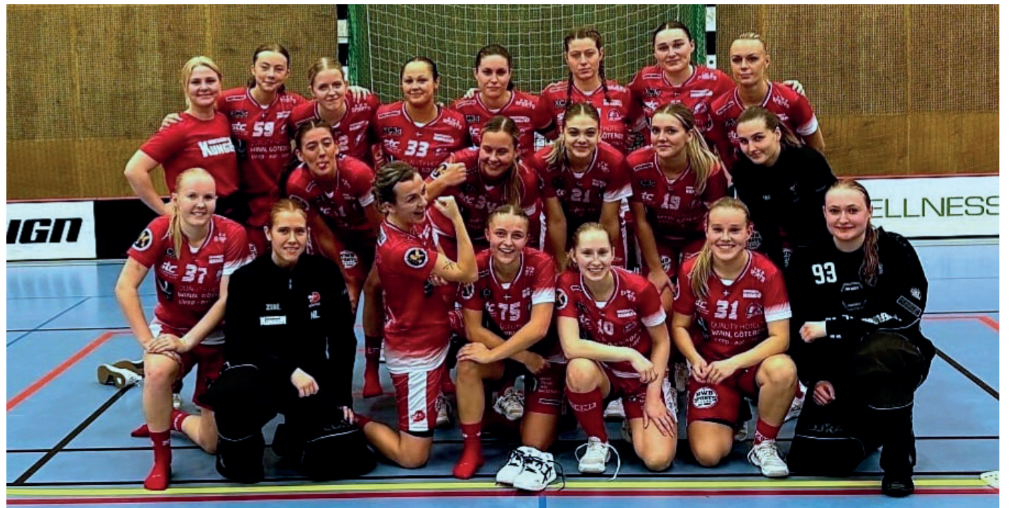
Backadalens damer vann mot IK Zenith.