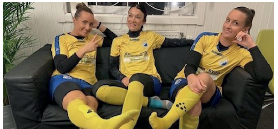
Tre nya spelare till Kärra KIF:s damer som kommer att passa perfekt in i truppen.