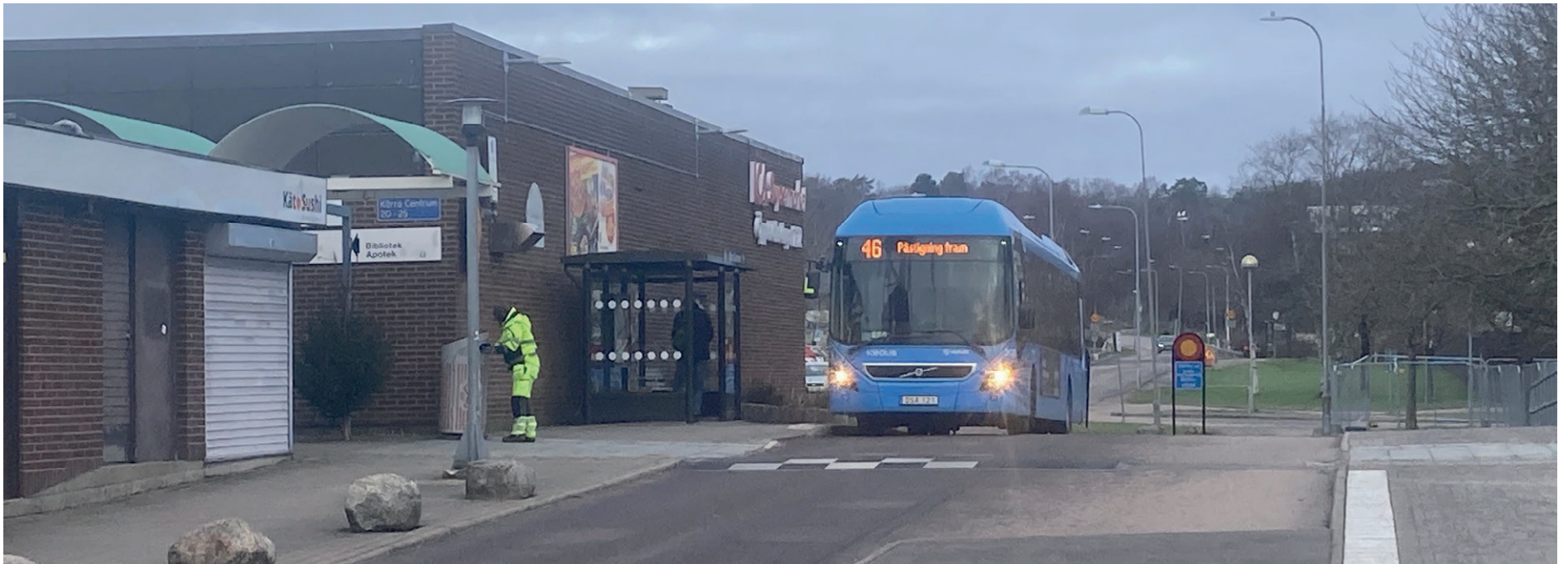
Från 15 december stängs busshållplatsen i Kärra Centrum