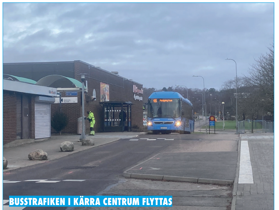
BUSSTRAFIKEN I KÄRRA CENTRUM FLYTTAS

Slöseriet med våra skattepengar fortsätter i Göteborg