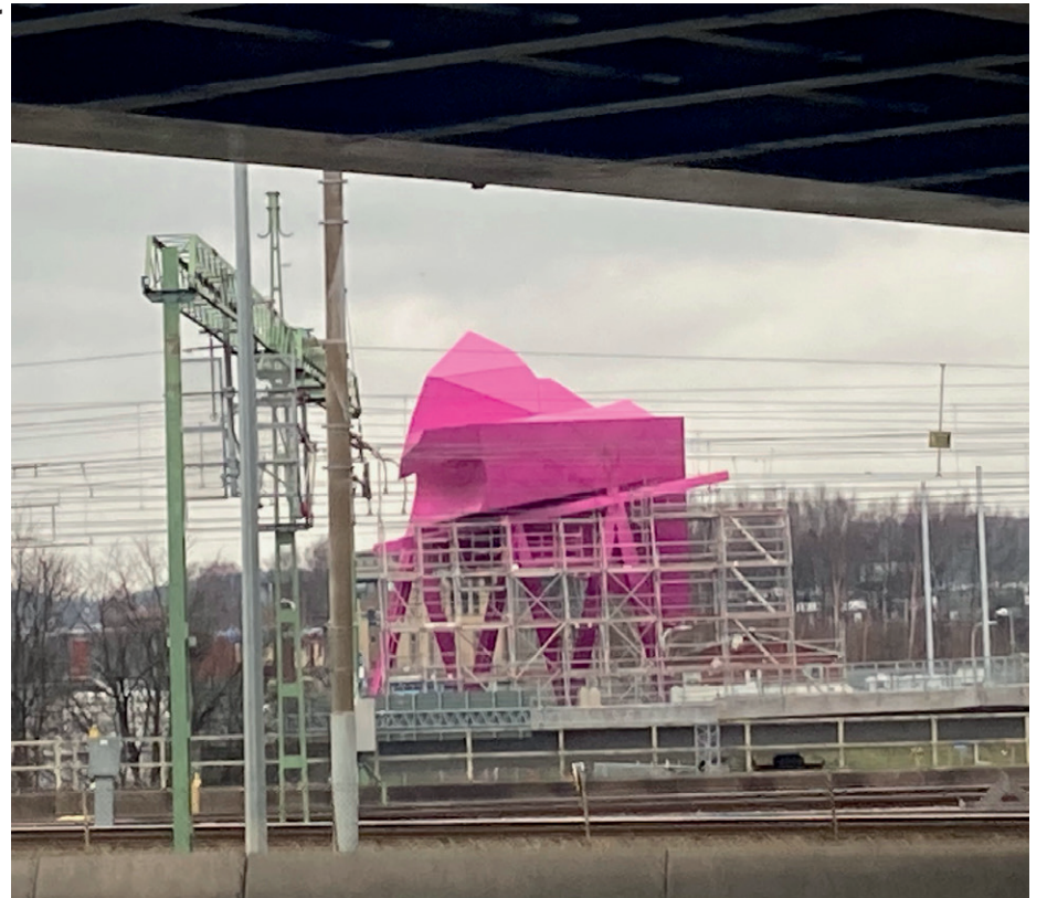
Konstverket "Blink" för Västlänken, vid Olskroksmotet, har nu blivit mer än dubbelt så dyrt. än det var tänkt från början. Senaste beskedet är att notan hamnar på 74 miljoner, av våra skattepengar.

LAG OCH ORDNING - Sätta upp kameraövervakningar på våra torg och gator, samt införa kvarterspoliserna med ett poliskontor i varden stadsdel dygnet runt. Allt för ett tryggare Göteborg. Vet att många skriker högt om att det kostar alldeles för mycket. Ok, det kostar en slant, men är det bättre att som nu med